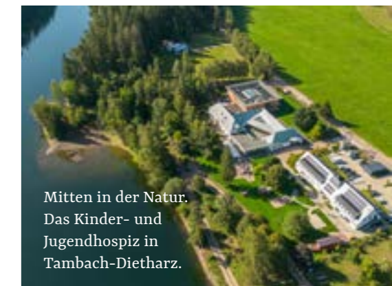
Mitten in der Natur. Das Kinder- und Jugendhospiz in Tambach-Dietharz.

„ Der Besuch dort zeigte, dass es ein schöner und freundlicher Ort ist – eher wie ein Urlaubsort als ein Krankenhaus. “