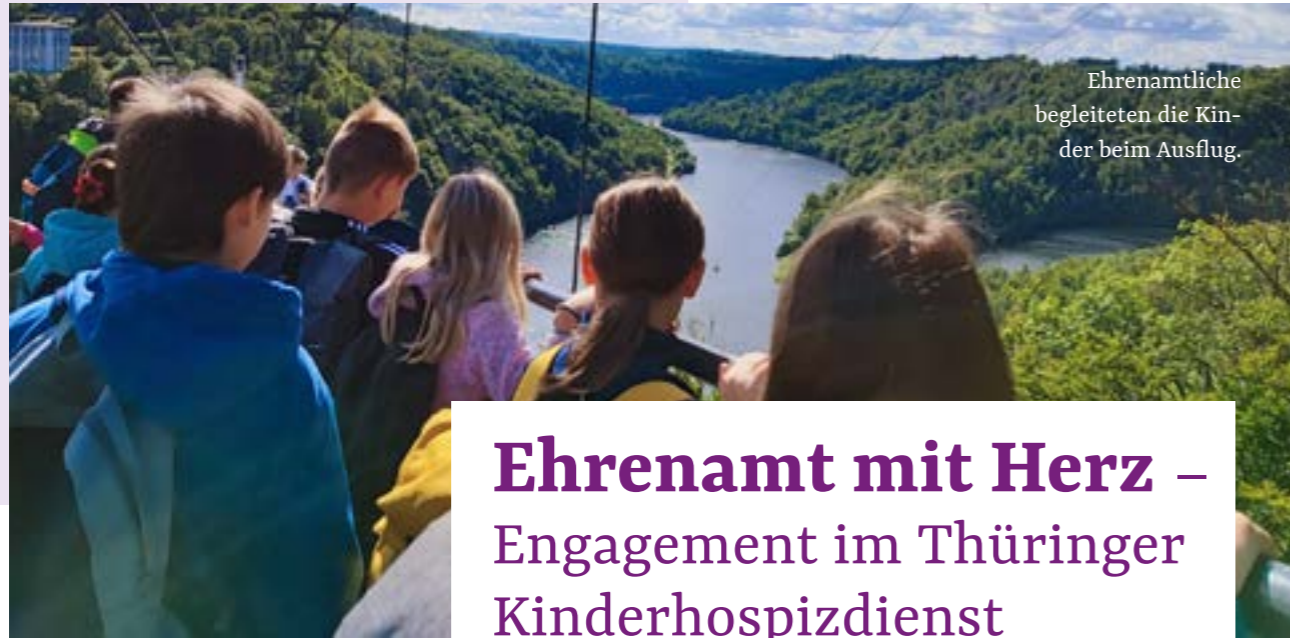
Ehrenamtliche begleiteten die Kin- der beim Ausflug.