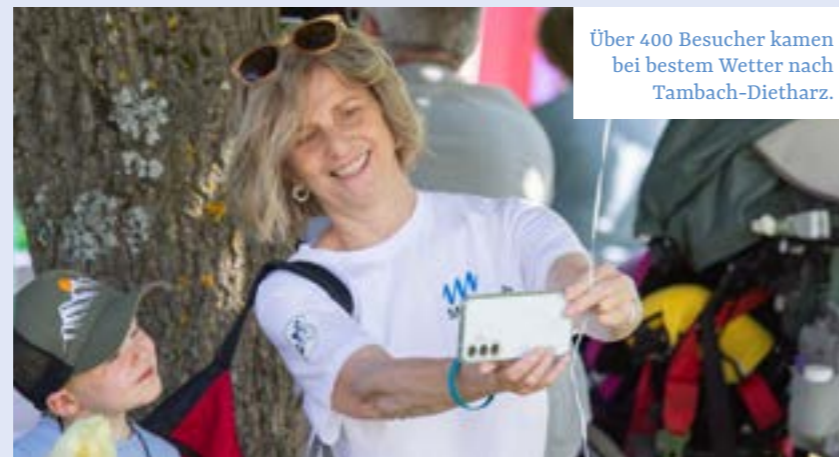
Über 400 Besucher kamen bei bestem Wetter nach Tambach-Dietharz.

zusammenkommen , um gemeinsam innezuhalten, Fragen zu stellen und aktuelle Entwicklungen zu besprechen. Neben interessanten Einblicken in unsere stationäre Einrichtung, gab es auch kulinarische Köstlichkeiten, musikalische Momente und vielfältige Mitmachaktionen. Doch das absolute Highlight war die Verlosung unserer Spendenschwalbe!